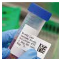
コニカルチューブ