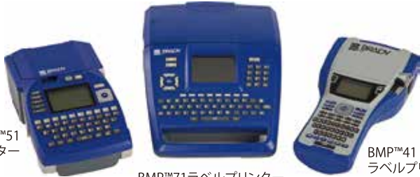
BMP™51 ラベルプリンター

ブレイディのBMPシリーズポータブルラベルプリンターは、バッテリーでも駆動。だから、電力確保の難しい現場に持ち込んで、その場でラベルを出力できます。