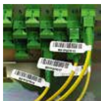
フラッグタイラベル