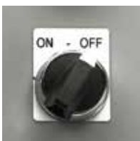
制御盤押しボタン