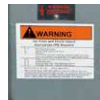
屋外向け警告ラベル