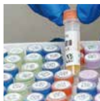
クライオチューブ