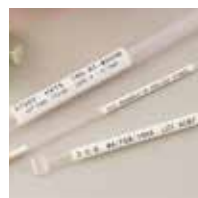
凍結保存用ストロー