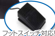
フットスイッチ対応!