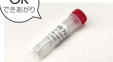
ラベル印刷+貼り付けを自動で実行