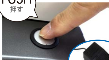
ボタンを押して スタート