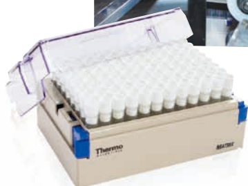
96本(1cc)フォーマットバイアルボックス